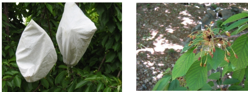
شکل ۲- خودناسازگاری در رقم عدلی در گرده افشانی ایزوله