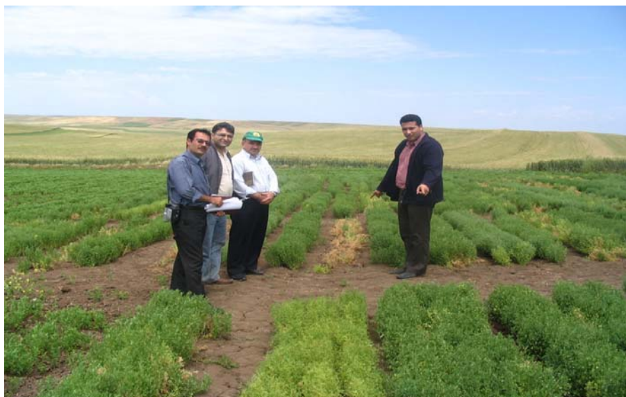
شکل ۲- رقم حساس محلی (بوته خشک شده) و رقم متحمل به بیماری پژمردگی فوزاریومی (رقم بیله سوار) در مزرعه آلوده کشاورز به این بیماری در منطقه بیله سوار مغان