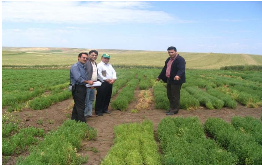
شکل ۲- رقم حساس محلی (بوته خشک شده) و رقم متحمل به بیماری پژمردگی فوزاریومی (رقم بیله سوار) در مزرعه آلوده کشاورز به این بیماری در منطقه بیله سوار مغان